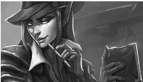
Foto de Zachary Archer, elfo oscuro (drow) de nacimiento y columnista con más experiencia en toda la historia del periodismo de seres mágicos. No lo digo yo, lo dicen los miles de alumnos que aprendieron de mí (risas). Uno de los pocos supervivientes a la devastación de su pueblo varios siglos atrás. Su curiosidad no tiene límites. Su lema: «Todos los secretos deben ser revelados».