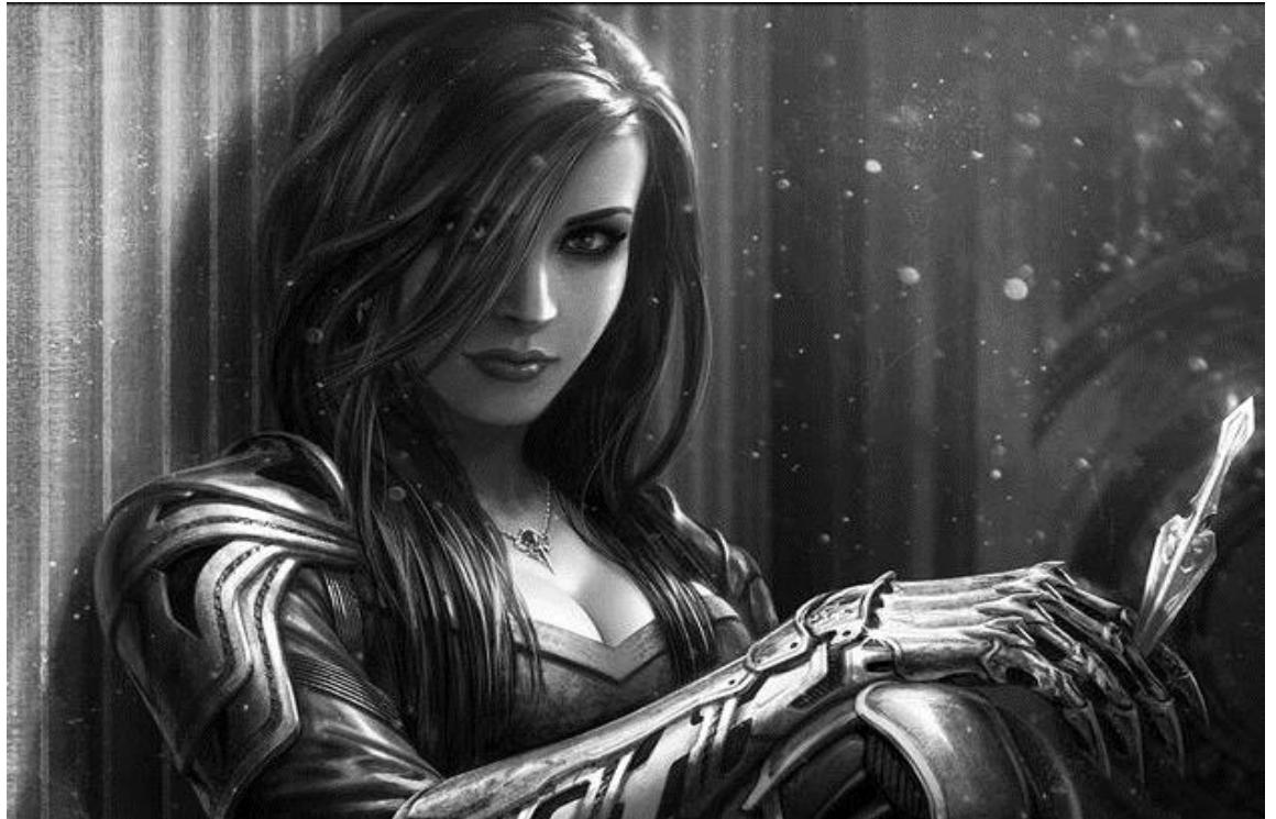
Foto de Ryoko Aoyama. Coprotagonista de la saga de literatura de fantasía «Las Tierras de la Eternidad».

Foto de Zachary Archer, elfo oscuro (drow) de nacimiento y columnista con más experiencia en toda la historia del periodismo de seres mágicos. No lo digo yo, lo dicen los miles de alumnos que aprendieron de mí (risas). Uno de los pocos supervivientes a la devastación de su pueblo varios siglos atrás. Su curiosidad no tiene límites. Su lema: «Todos los secretos deben ser revelados».