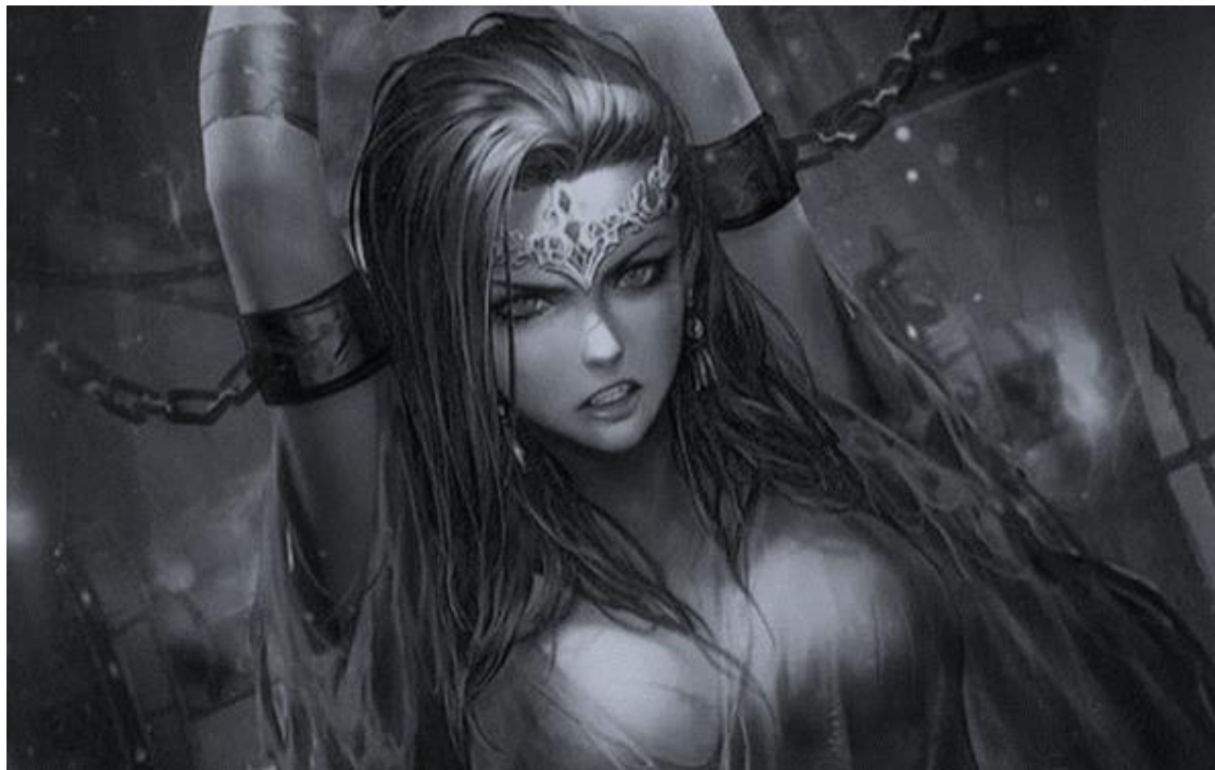
Foto de Neko. Diosa del hielo de la saga de literatura de fantasía «Las Tierras de la Eternidad».

Foto de Zachary Archer, elfo oscuro (drow) de nacimiento y columnista con más experiencia en toda la historia del periodismo de seres mágicos. No lo digo yo, lo dicen los miles de alumnos que aprendieron de mí (risas). Uno de los pocos supervivientes a la devastación de su pueblo varios siglos atrás. Su curiosidad no tiene límites. Su lema: «Todos los secretos deben ser revelados».