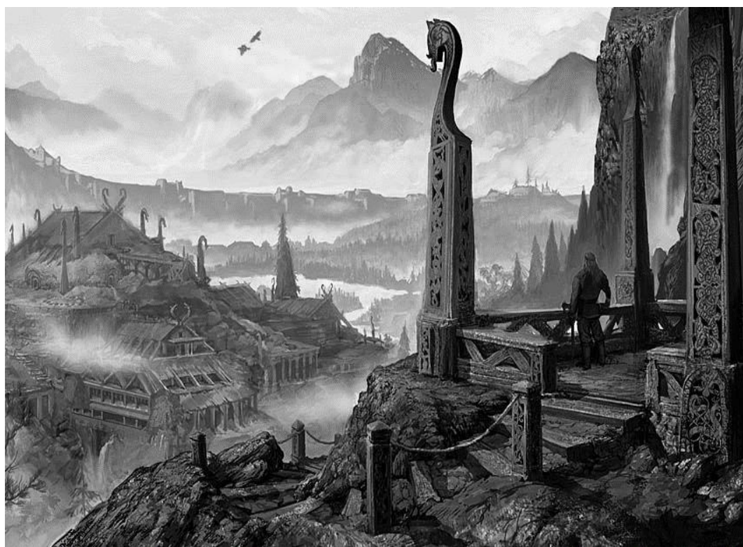
Caer Lukwos. Ubicado en la mitad de la montaña llamada Pico Colmillo. En el mismo centro de las Llanuras de Plata.